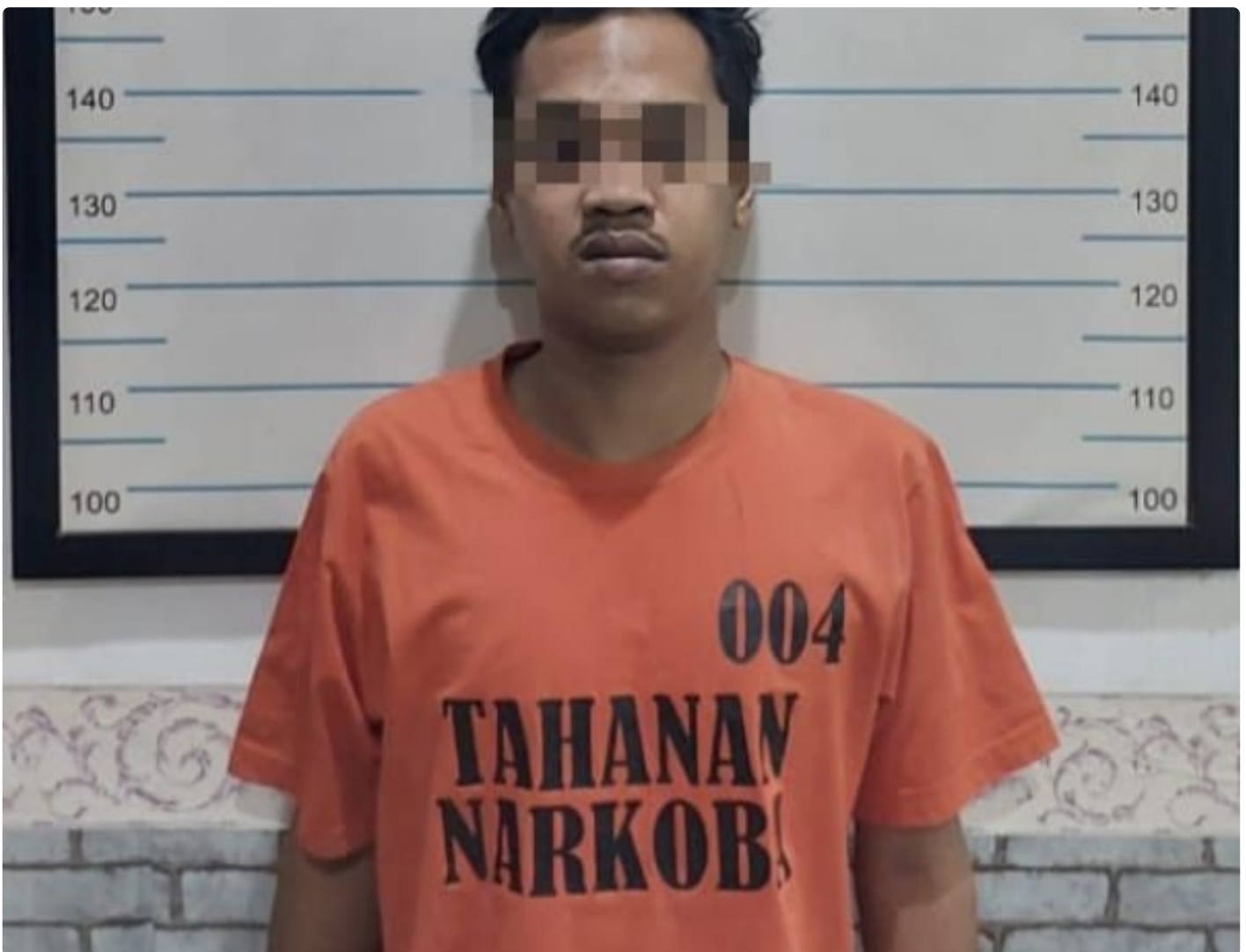
Sat Resnarkoba Polres Hulu Sungai Tengah Kembali Mengamankan Tersangka Penyalahgunaan Narkotika Jenis Sabu

BARABAI-Polres Hulu Sungai Tengah Polda Kalimantan Selatan- Satuan Resnarkoba Polres Hulu Sungai Tengah kembali berhasil mengamankan (TSK) , penyalahgunaan narkotika jenis sabu-sabu. Senin 16/1/2023 skj 20.00 wita